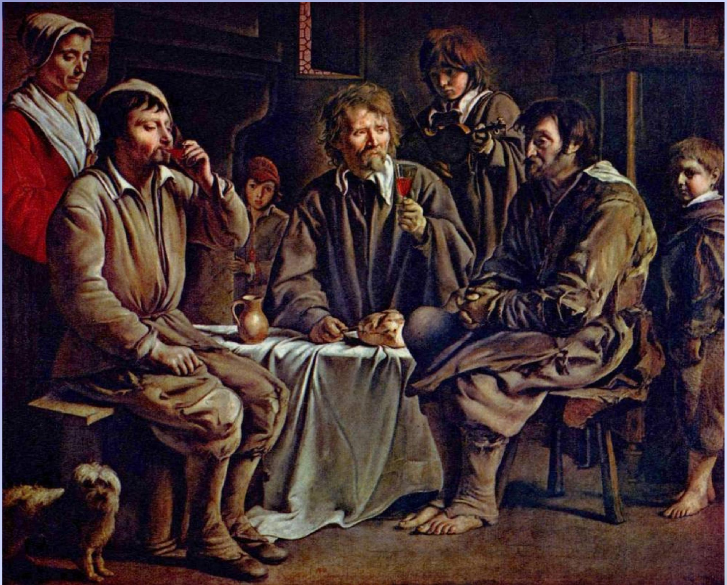
Un repas de paysans peint par Louis Le Nain en 1642.