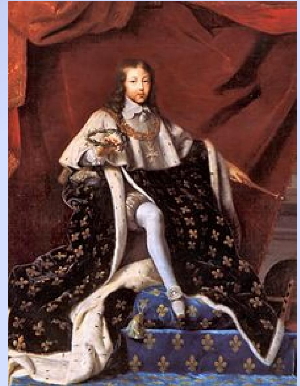
Portrait de Louis XIV âgé de 10 ans, mais déjà roi de France.

Le début du règne est troublé par la révolte de la noblesse : c'est la Fronde (1648-1653).