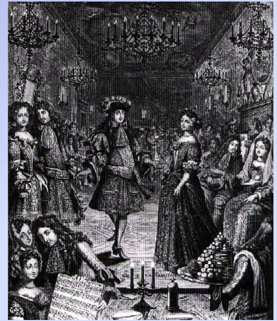
Un bal à la cour de Louis XIV. Gravure de 1682.

Ainsi, Louis XIV prend très au sérieux sa fonction de mécène , considérant que l'art doit être au service de sa gloire : il soutient des auteurs prestigieux venus à sa cour, comme Racine et Molière, et met en place de nombreuses académies destinées à promouvoir les arts et les sciences. L'Académie de peinture et de sculpture, l'Académie des sciences ou encore l'Académie de musique sont parmi les plus connues.