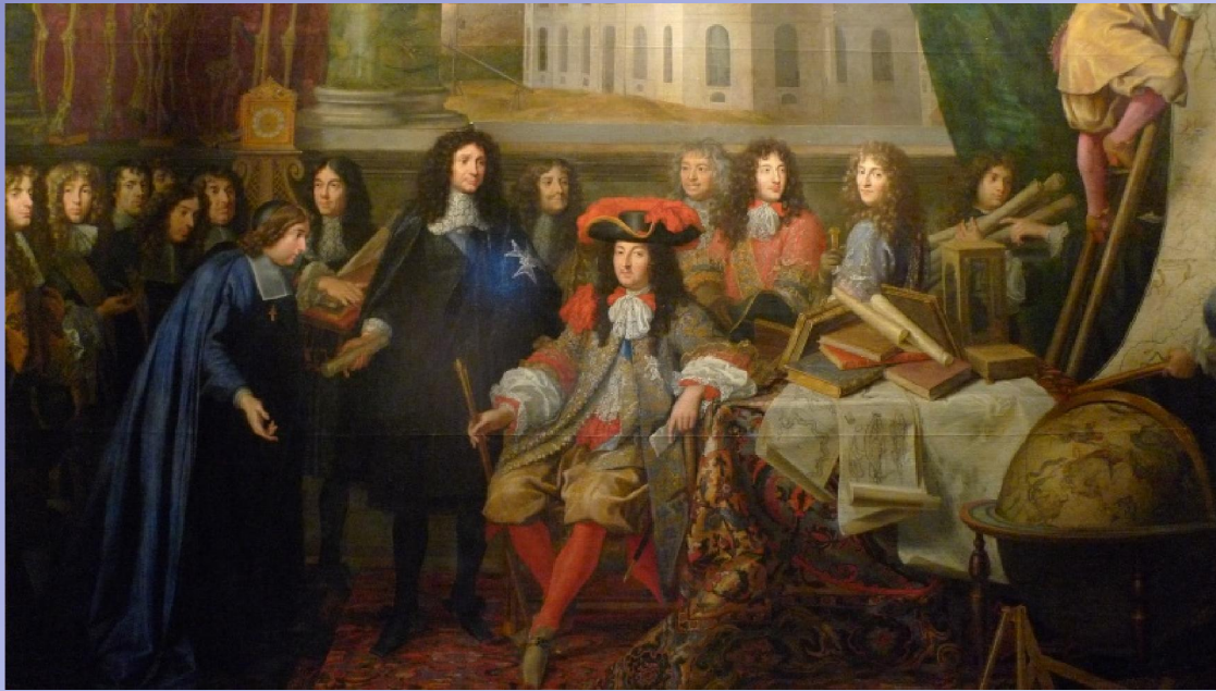
Louis XIV à la réception de l'Académie des sciences, peint par Charles Le Brun.