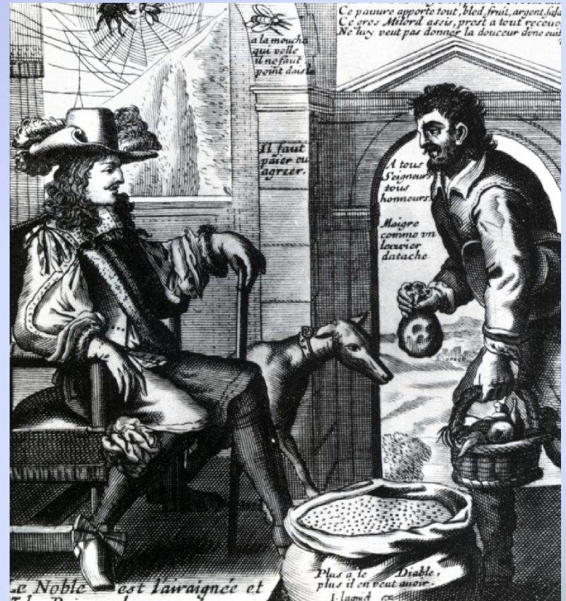
L'araignée et la mouche, gravure

Les mauvaises récoltes et les épidémies de peste sont fréquentes. En 1709, la France connaît une famine terrible. Les paysans, les ouvriers agricoles et les petits artisans ont pour principale préoccupation de se nourrir pour survivre .