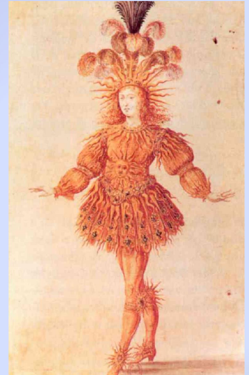
Portrait de Louis XIV, le roi soleil